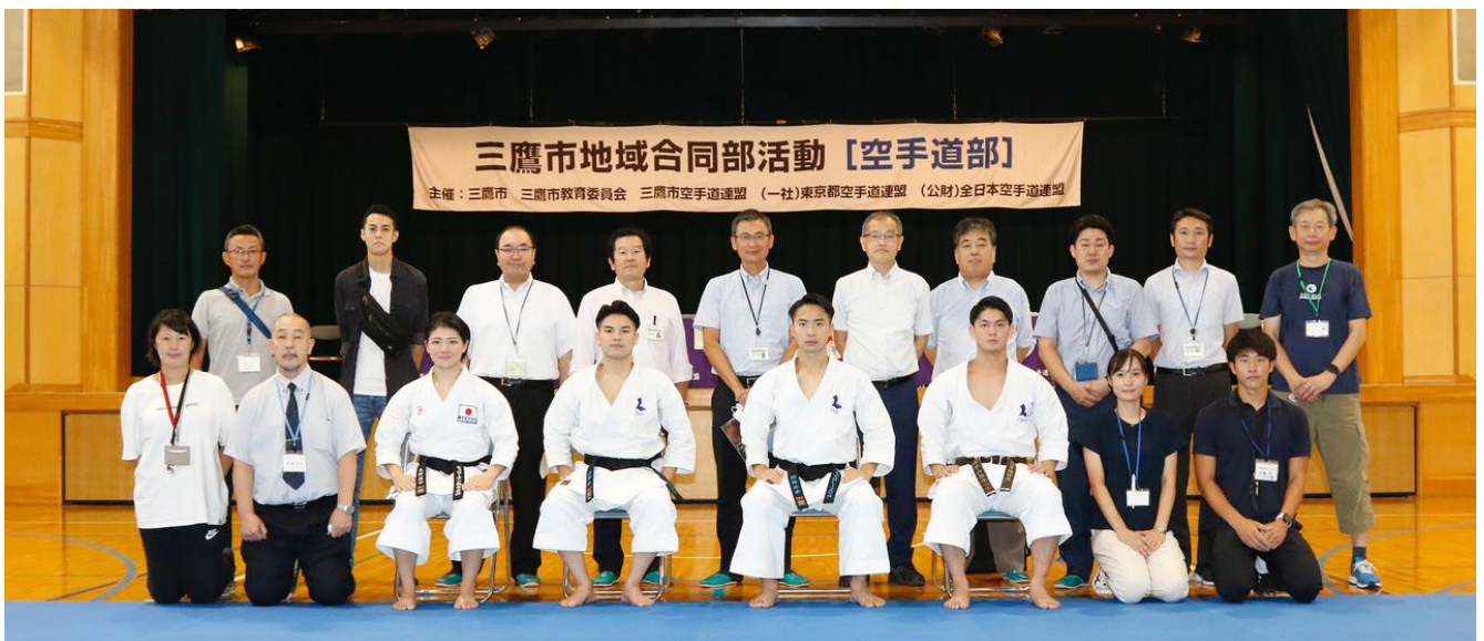
三鷹市教育委員会と中学校関係者 第2会場(三鷹2中)