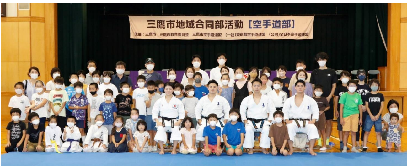
参加者と演武者 第2会場(三鷹2中)