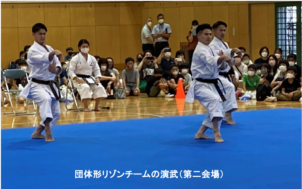
団体形リゾんチームの演武(第二会場)