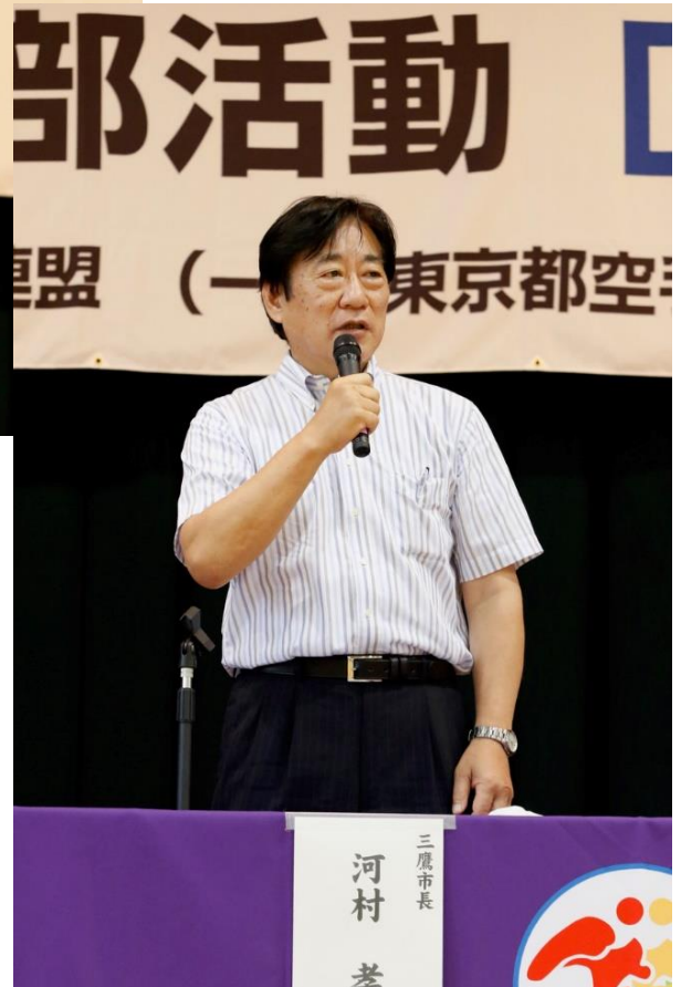
三鷹市長 河村 孝