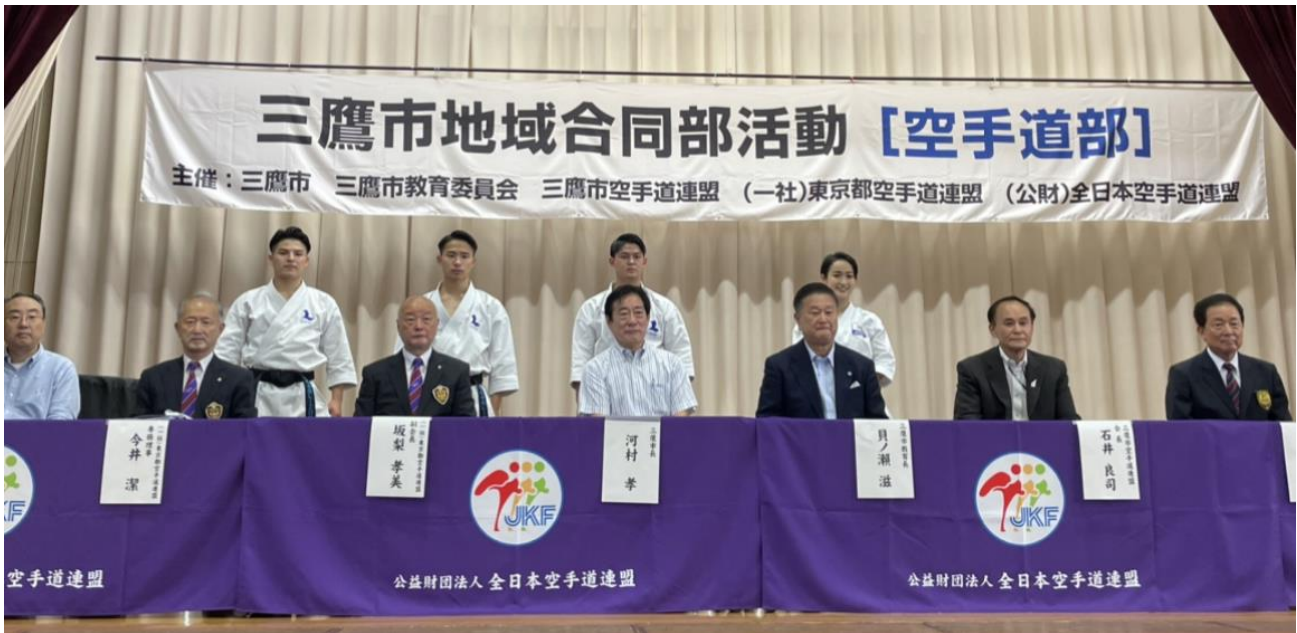
来賓と演武者 第一会場(三鷹6中)