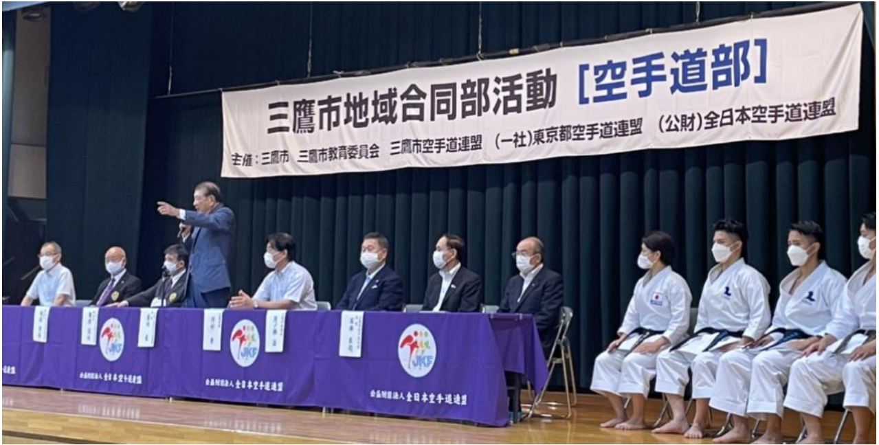
開会式 第2会場(三鷹2中)