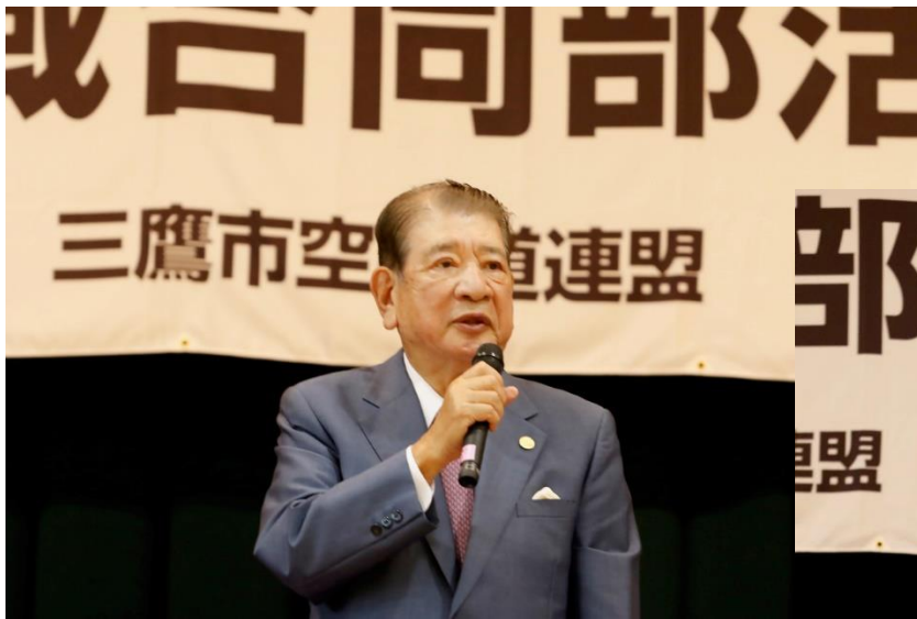
公益財団法人全日本空手道連盟 会長 笹川 堯